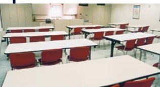
Aula Scuola Bellini