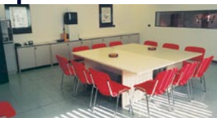
Aula Meeting Rossini